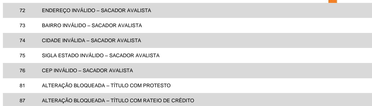
TABELA 3 – Instruções rejeitadas (código da ocorrência = 16 na posição 109 a 110)